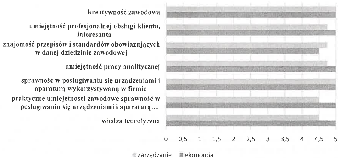
Rysunek 1. Średnia ocena przygotowania merytorycznego studentów kierunku ekonomia oraz kierunku zarządzanie Wydziału Ekonomicznego ZUT w Szczecinie do wykonywania obowiązków zawodowych wg hospitowanych zakładowych opiekunów praktyk

Zakładowi opiekunowie praktyk oceniali hospitowanych studentów pod względem ich merytorycznego przygotowania do wykonywania obowiązków zawodowych w zakresie działalności organizacji, w jakiej realizowane były praktyki, w skali od 1-5 (tam, gdzie dana cecha była istotna). Wyniki przedstawia rysunek 1.